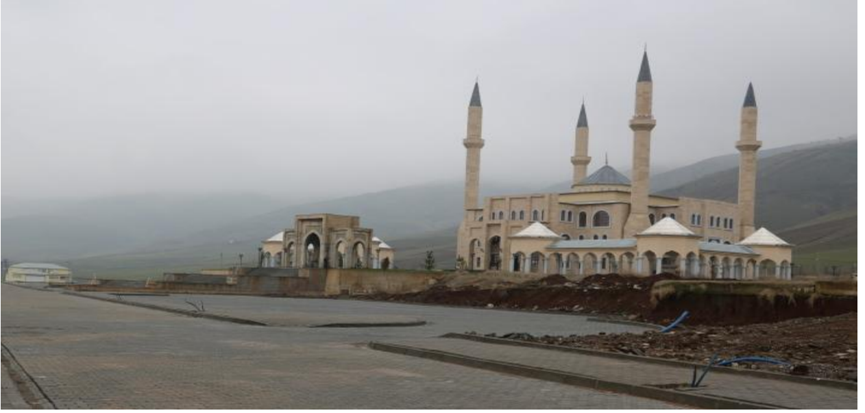
Resim 6 Sultan Muhammed Alparslan Cami

Türkiye Diyanet Vakfı tarafından yapımı üstlenilen Sultan Muhammed Alparslan Cami'sinin peyzaj çalışmaları devam etmektedir.