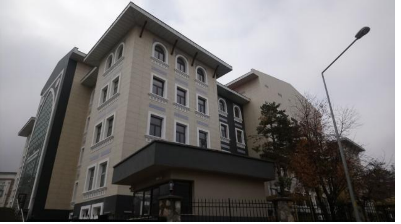
Resim 4 İslami İlimler Fakültesi

“Derslik ve Merkezi Birimler” projesine baęlı olarak; 2020 yılında ihalesi yeniden yapılan 14.000 m 2 kapalı alana sahip “İslami İlimler Fakültesi” yapım işinin, 2021 yılsonu itibariyle %100 tamamlanmıştır.