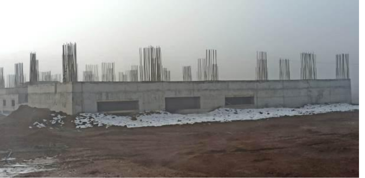
Resim 3 Malazgirt MYO

“Derslik ve Merkezi Birimler” projesine baęlı olarak; 2021 yılında ihalesi yapılan 4.215 m 2 kapalı alana sahip “Malazgirt MYO” yapım işinin %17’si tamamlanmıştır.