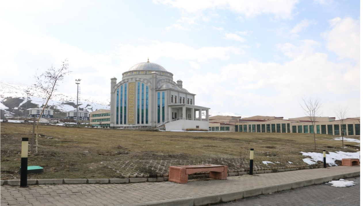
Resim 7 Gazze Cami

Muş Alparslan Üniversitesi Kalkındırma Vakfı tarafından yapımı üstlenilen Gazze Cami'sinin inşaat çalışmaları devam etmektedir.