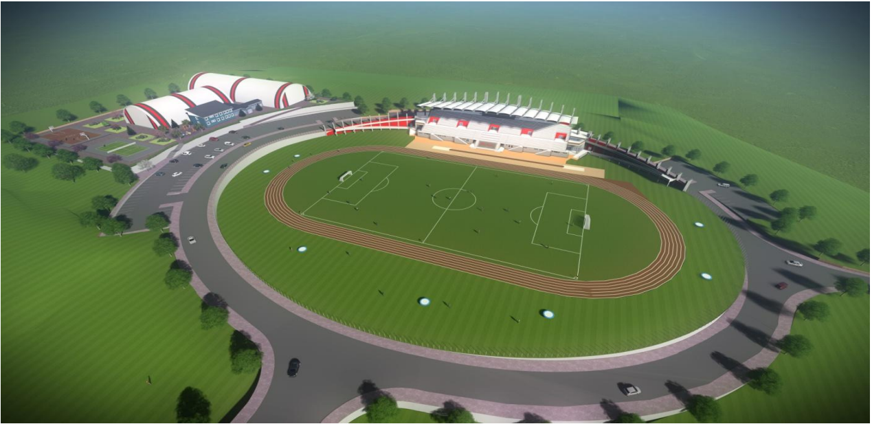
Resim 5 Açık Spor Tesisleri

"Açık ve Kapalı Spor Tesisleri" projesine baęlı olarak; 2020 yılında ihalesi yeniden yapılan 40.777 m 2 kapalı alana sahip “Açık Spor Tesisleri” yapım işinin 2021 yılsonu itibari ile %36’sı tamamlanmıştır.