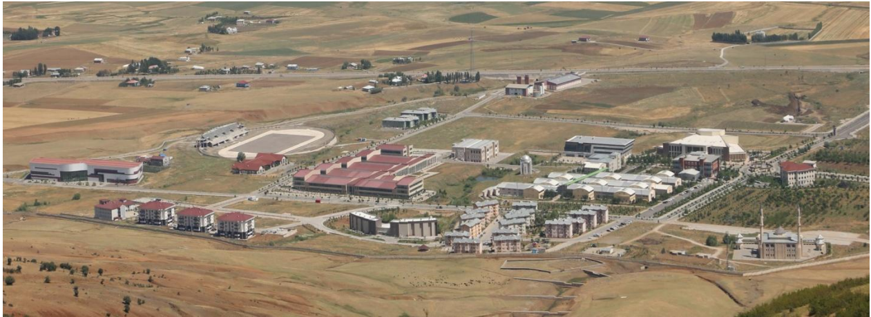
Resim 1 Merkez Külliye Alanı

“Kampüs Altyapısı” projesine bağlı olarak, 2021 yılında ihalesi yapılan “Altyapı” yapım işinin 2021 yılsonu itibariyle % 100’ü tamamlanmıştır.